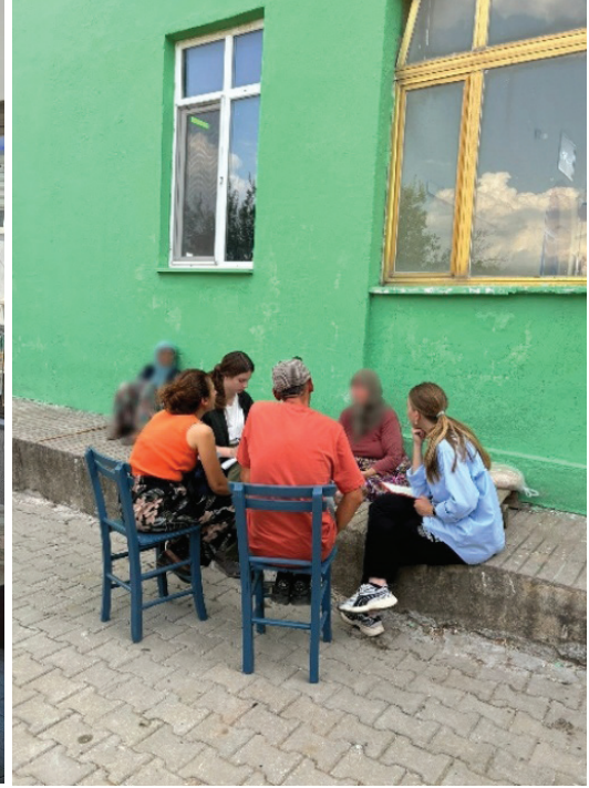
Tablo 1- Görüşmelerden görseller

kırsal sağlık ve psikososyal destek sistemleri anlaşılmaya çalışılmıştır. Görüşmenin son bölümünde ekonomik koşullar, çiftçiliğin geçim sağlamadaki yeterliliği, varsa ek gelir kaynakları ve geleceğe dair tarımsal planlar sorularak katılımcının ekonomik sürdürülebilirlik perspektifinin ortaya konması amaçlanmıştır.