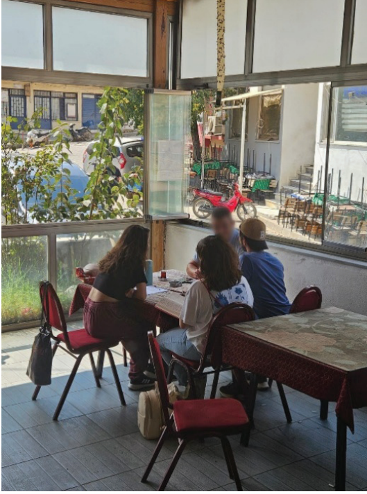
Tablo 1- Görüşmelerden görseller