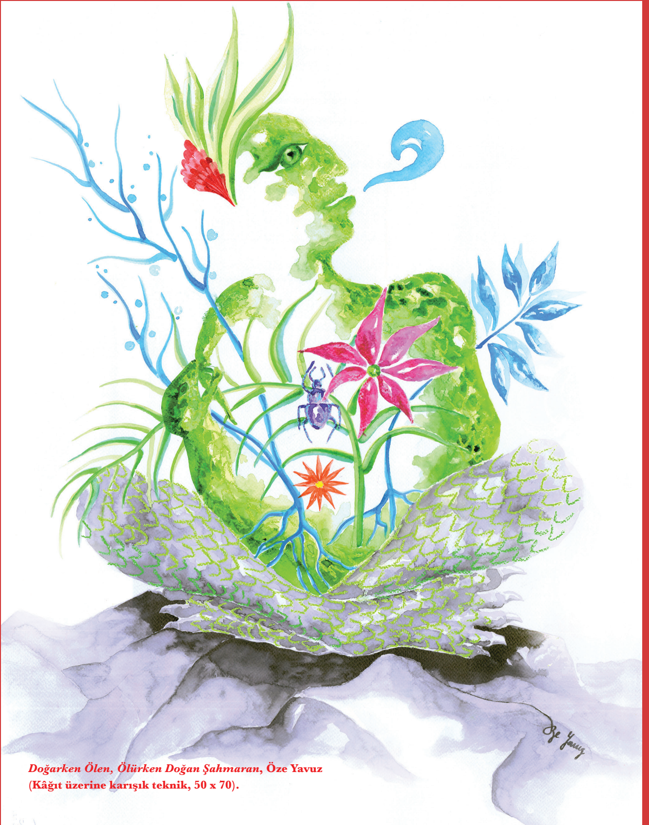
Doğarken Ölen, Ölürken Doğan Şahmaran, Öze Yavuz (Kâğıt üzerine karışık teknik, 50 x 70).