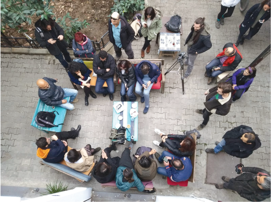
Görsel 4 hayy açık alan

Ne var ki İzmir'deki bağımsız kültür sanat girişimleri, bugün itibariyle cebinde son derece zengin bir tecrübe birikimi taşıyor ve bu yapılar bence İstanbul'dan farklı olarak, olumlu bir zemin olduğu anda biriktirdikleri tecrübe havuzundan yepyeni yerler üretmeye teşne görünüyor. Zira İzmir'in parçalanmamış komünite anlayışı, koşullar ne olursa olsun; yaşamı bildiği şekilde sürdürmekteki direnci ve kalenderliği, bugüne kadar varlığını sürdürmüş bağımsız yapıların ileride yepyeni modellerle hayata karışmasına olanak tanıyor.